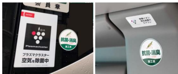
空気触媒「セルフィール」施工および「除菌イオン発生装置付きエアコン」装備を示すステッカーを車両の内外に掲示しています。