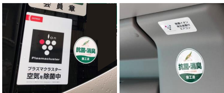
空気触媒「セルフイール」施工および「除菌イオン発生装置付きエアコン」装備を示すステッカーを車両の内外に掲示しています。